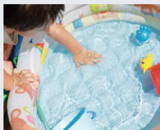
給水栓があるので夏時は プール遊びも