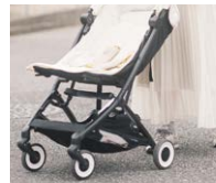
生活動線がスムーズ