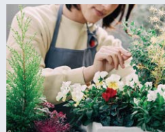
ガーデニングプランター菜園も

専用テラスで叶う 充実のガーデナライフ LIFE WITH PRIVATE GARDEN