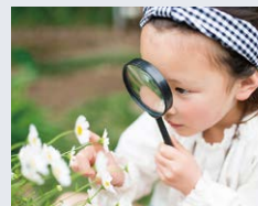
子ども達の安全な遊び場に

※避難経路となります。避難の妨げになるものは置かなくてください。 ※全て Image Photo