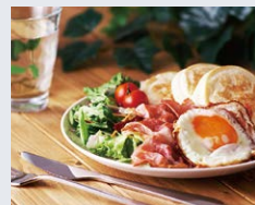
晴れの週末はピクニック気分でランチ