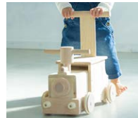
生活音の配慮を軽減